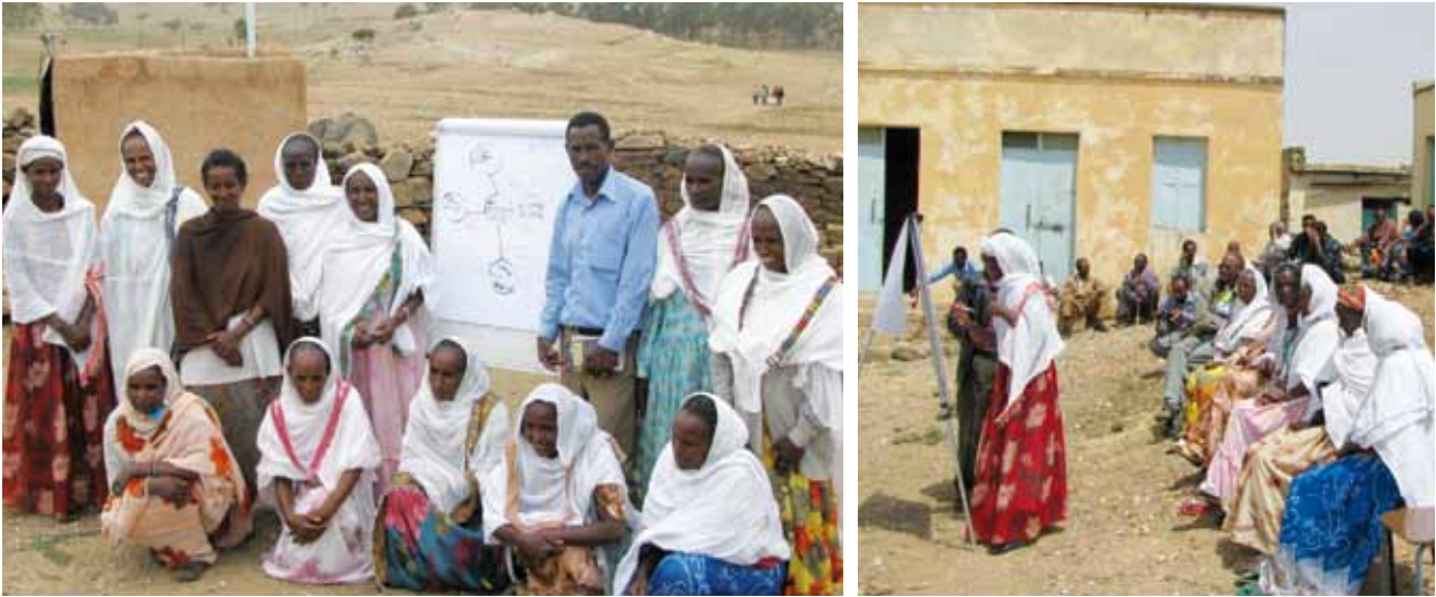
A gauche : Les leaders naturels posent aux côtés du Chef du village et d'une carte indiquant les trois villages. À droite : Des leaders naturels en Érythrée ont pris la décision de nettoyer les trois villages limitrophes après les avoir déclarés FéDAL.

très bien le manuel ATPC et se familiariseront avec la terminologie ATPC avec d'entamer la lecture du présent guide de formation.