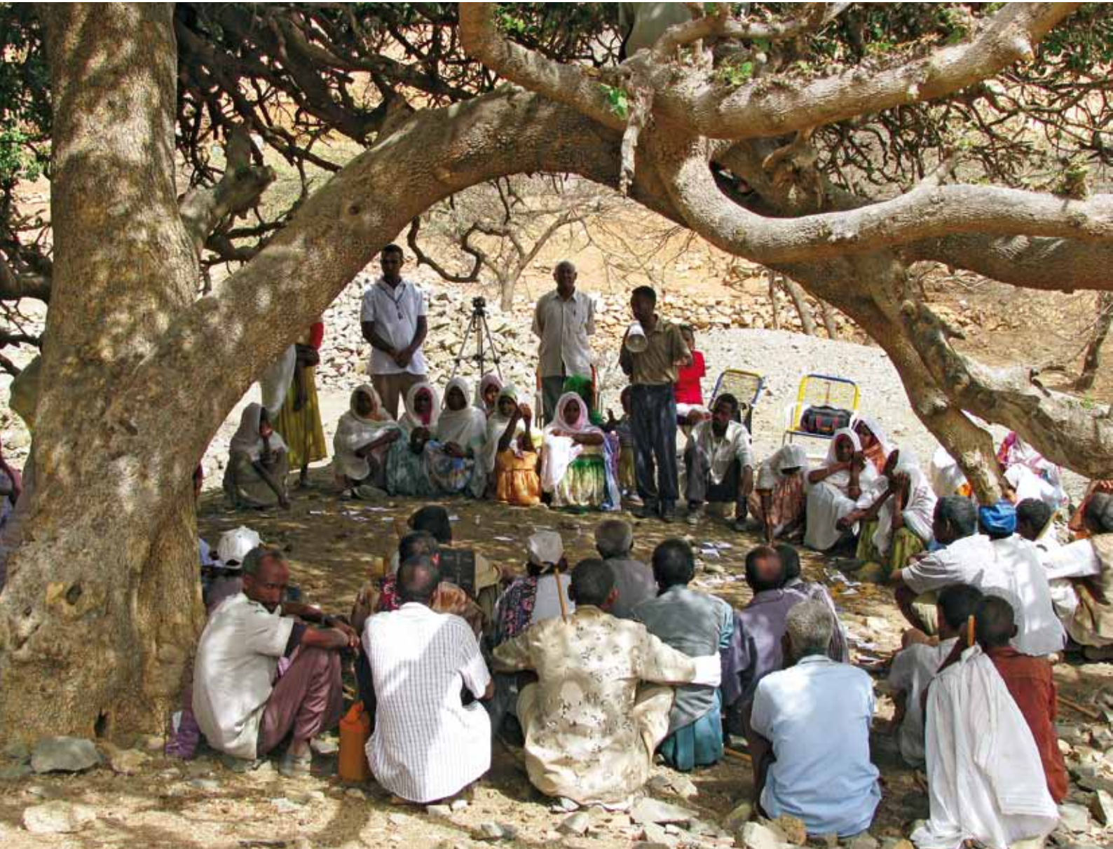
On a demandé au caméraman de sortir de la carte dessinée au sol et de filmer discrètement sans déranger la séance de déclenchement.