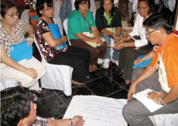
Des formateurs participants lors d'une réunion en petit groupe – Samar oriental, aux Philippines.

Cette grille se veut flexible et s'est avérée pratique dans le cadre de la séquence et de la planification. La première journée est particulièrement intense. Il est possible que les participants ne se sentent pas prêts pour le déclenchement le deuxième jour. Toutefois, ne perdez pas de temps car l'apprentissage est une tâche de longue haleine.