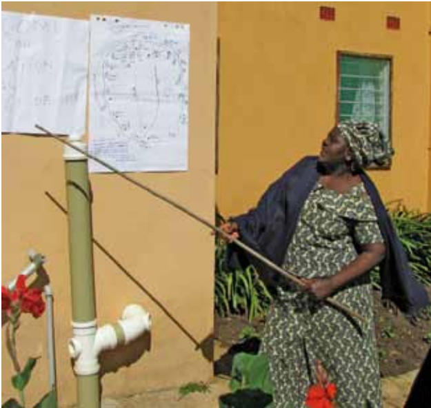
Une femme d'une communauté déclenchée lors de sa présentation, à Chisamba, en Zambie.

Noter sur un tableau à feuilles mobiles ou tout autre support les objectifs de l'atelier. Lisez-les à haute voix et demandez si les participants les comprennent. Demandez s'ils ont besoin de précisions. Faites le lien entre les objectifs et les attentes.