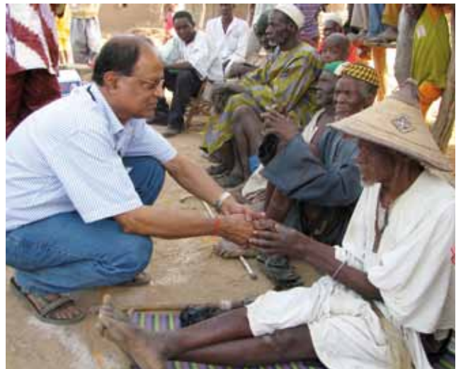
Le respect du leadership de la communauté locale est essentiel. Le Chef d'un village du Mali est salué avant le démarrage du processus de déclenchement de l'ATPC.

de l'ATPC du plus grand nombre de groupes possible. Déplacez-vous assez rapidement avec le caméraman et passez un peu plus de temps avec les groupes moins actifs. Utilisez un véhicule afin de voyager plus rapidement entre les groupes ;