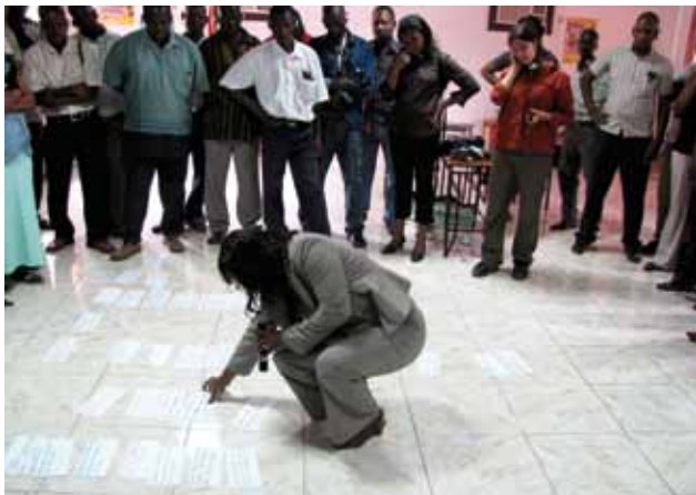
Des formateurs participants classent les fiches des attentes par sujet – au Mozambique.

Facilitez une session participative afin de fixer les normes en matière de comportements et d'interaction, tels que la ponctualité, le fait de ne pas partir avant l'heure, d'éteindre son téléphone portable, de ne pas interrompre les autres et de respecter les durées convenues pour le travail en groupe. Il est donc préférable de désigner des gardiens du temps qui siffleront, frapperont dans leurs mains ou feront d'autres bruits pour signaler le début ou la fin d'une activité et s'assurer que tout le monde respecte le chronogramme.