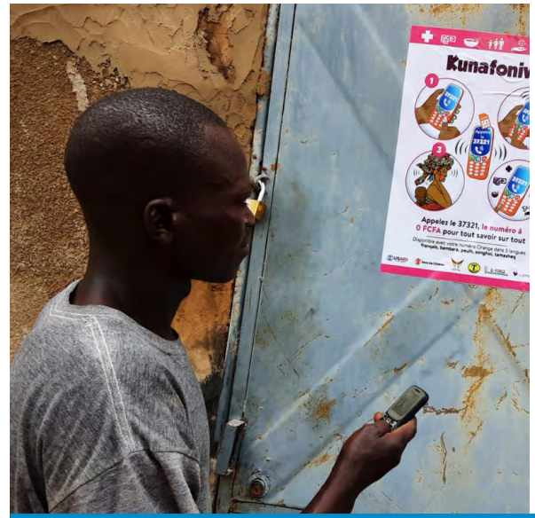
Une jeune bénéficiaire du village de Barapireli dans le cercle de Koro, région de Bandiagara, utilise l'affiche VIAMO pour les services de Kunafoniw 37321.