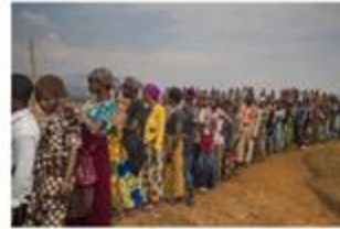
Conflict displacement, DRC - 2018