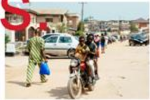
Ongoing threat of recruitment into non-state violent groups (NE Nigeria), 2018