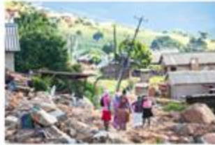
Cyclone Idai, Zimbabwe - 2019