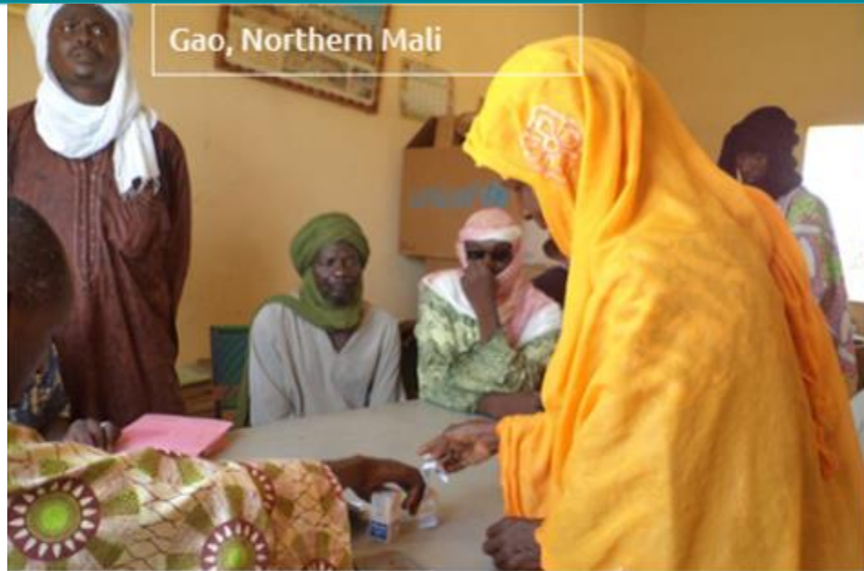
Gao, Northern Mali