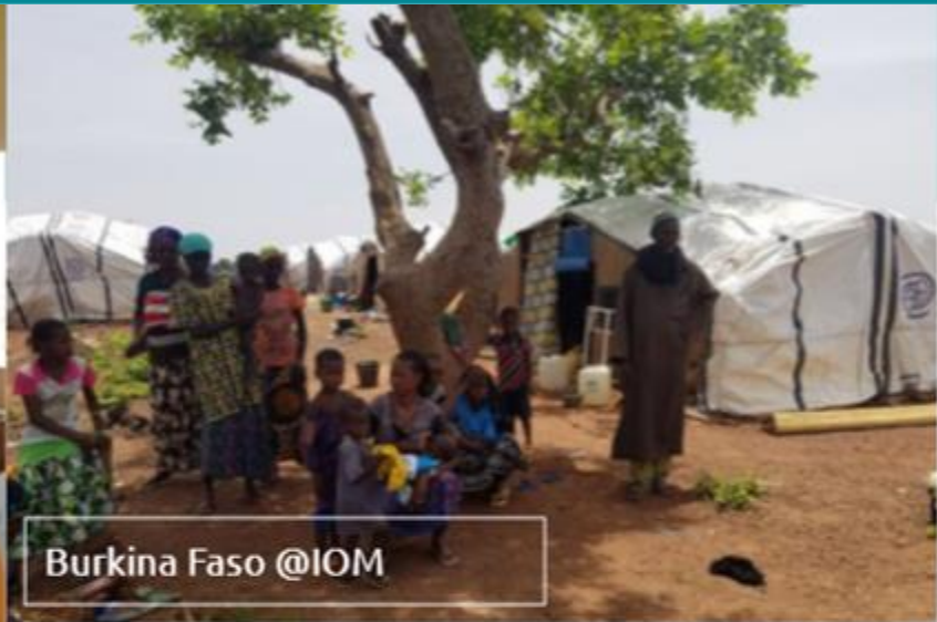
Burkina Faso