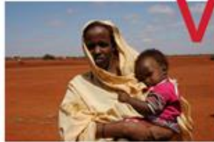
Horn of Africa Drought (Ethiopia) - 2011/2012