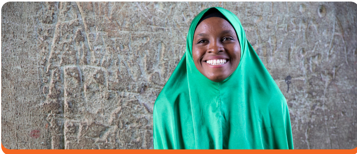
Una joven mujer en Biu, Nigeria que ahorra para su pequeña negocio de azúcar en una VSLA. Ezra Millstein/Mercy Corps, 2018.