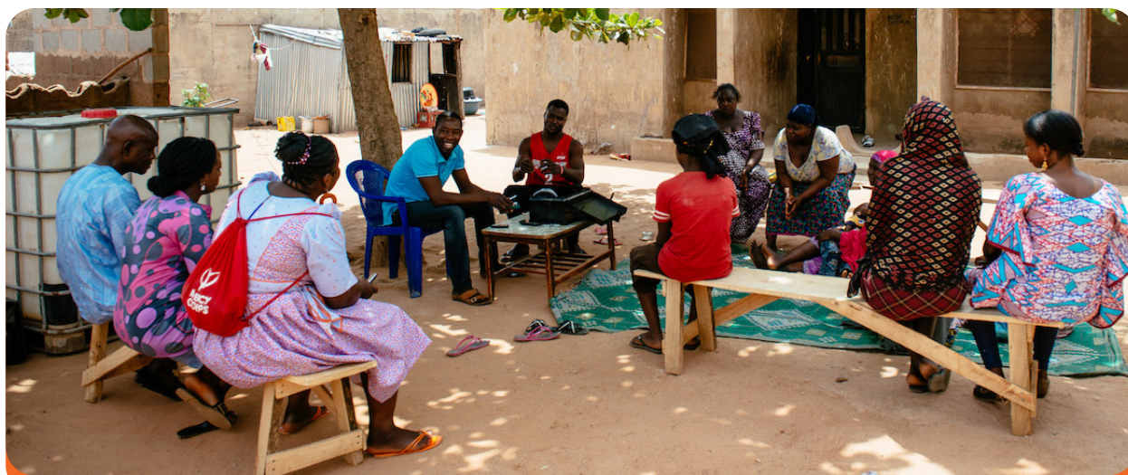
Un grupo de ahorro se reúne en Gombe. El grupo se estableció como parte de una respuesta humanitaria a la crisis en el noreste de Nigeria.

Las mujeres continuaron profundizando estos lazos de solidaridad y apoyo recíproco, tanto dentro como fuera de la estructura de VSLA, simplemente “estando ahí” unas para otras. Este “estar allí” fue tanto económico (decidir donar los fondos sociales de VSLA a una mujer miembro necesitada, por ejemplo) como emocional (ir colectivamente a la casa de una nueva madre con regalos o simplemente para ayudarla con las tareas domésticas). Estas relaciones continuas ayudaron a las mujeres a diversificar sus conexiones sociales. “Antes, [yo] no conocía a muchas mujeres en la comunidad. Pero ahora voy a sus casas, nos aconsejamos unas a otras y hay un vínculo”, dijo una participante de VSLA.