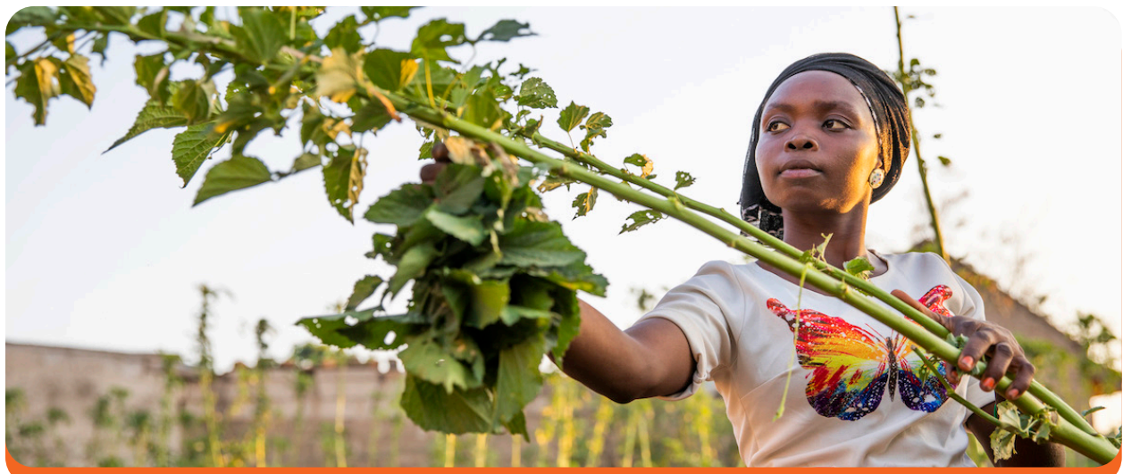
Una mujer se prepara para secar maíz en el frente de su casa en el Estado de Borno, Nigeria.

La participación financiera que proporcionaron estas dos intervenciones aumentó la confianza de las mujeres en sí mismas. Un participante del programa dijo: “Antes, [cuando] no estaba haciendo nada, estaba muy enojado, triste. Pero ahora sé que el dinero vendrá porque tengo [un modo de vida]”. Las aspiraciones también mejoraron. “Con las ganancias de mis ventas de aves de corral, me he expandido a la venta de telas; ahora estoy trabajando para comprar un refrigerador para poder vender bebidas y agua fría”, dijo otro participante del programa. Los participantes también informaron que se habían ganado el respeto de sus compañeros. “Mis amigos me llaman Hajiya, alguien de una clase superior”, dijo un participante. Todas estas intervenciones beneficiaron el fortalecimiento del empoderamiento de las mujeres. El personal del programa señaló que las mujeres ahora “exigían insumos de [mejor] calidad e información y servicios de los actores del mercado sobre cómo criar pollos más saludables”.