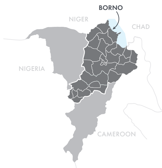
Figura I: Mapa del noreste de Nigeria

La investigación muestra que los mercados 2 y las redes sociales 3 —familia, amigos y vecinos—son fuentes esenciales de resiliencia en crisis prolongadas, donde la gobernanza formal es en gran medida débil o está totalmente ausente. También estamos aprendiendo que la autoeficacia, la participación y la confianza en el futuro son predictores importantes de la capacidad de un individuo o de un hogar para escapar y permanecer fuera de la pobreza frente a las crisis. 4 Esta evidencia plantea la pregunta: ¿Cómo fortalecemos estas importantes fuentes de resiliencia en crisis prolongadas? Este documento de aprendizaje arroja luz sobre esta pregunta a través de un estudio de caso de dos programas basados en el mercado en el noreste (NE) de Nigeria. Descubrimos que las intervenciones de modo de vida junto con los colectivos económicos 5 son efectivos para fortalecer las capacidades de resiliencia, tales como las conexiones sociales recíprocas, el empoderamiento de las mujeres y la mejora del bienestar psicosocial, específicamente las percepciones de la propia participación y confianza en el futuro. En este documento compartimos tres caminos clave a través de los cuales esta combinación de intervenciones tiene un impacto positivo en las fuentes sociales y psicosociales de resiliencia, y hacia dónde podemos avanzar con estas conclusiones.