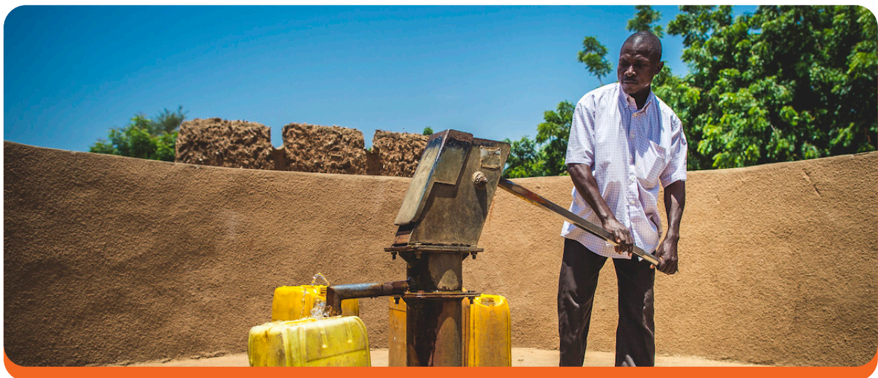
Un homme pompe de l'eau à Zinder, au Niger. Sean Sheridan/Mercy Corps, 2016.