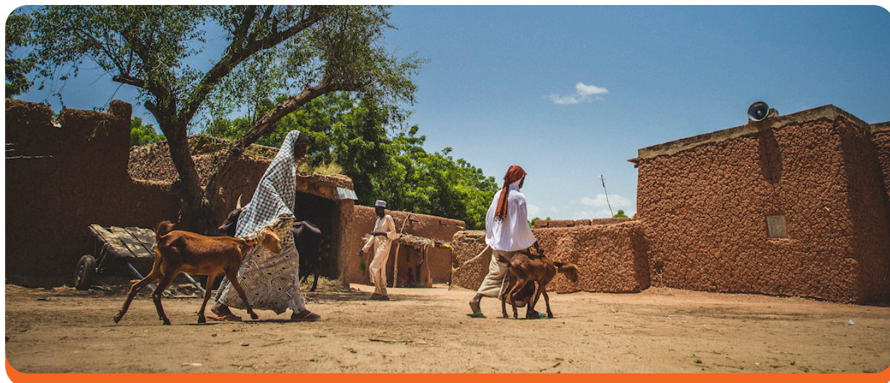
Des sœurs marchent aux côtés de leurs chèvres à Zinder, au Niger. Sean Sheridan/Mercy Corps, 2016.

Points clés à retenir : Les interventions conçues pour renforcer l'action collective peuvent ne pas instaurer automatiquement la confiance. Les programmes devraient également favoriser une interaction positive accrue et suivre l'évolution des perceptions en réponse aux activités de promotion de l'action collective.