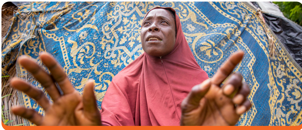
Une femme de Baleyara, au Niger, nettoie un panier de moringa devant sa maison. Ezra Millstein/Mercy Corps, 2018.

Points clés à retenir: Les programmes devraient chercher à remédier aux disparités de participation entre les femmes et les hommes lors de la conception et de la mise en œuvre d'interventions visant à accroître la cohésion sociale, en se concentrant sur l'augmentation de l'inclusion des femmes dans les processus de prise de décision afin de maximiser les résultats de la cohésion sociale.