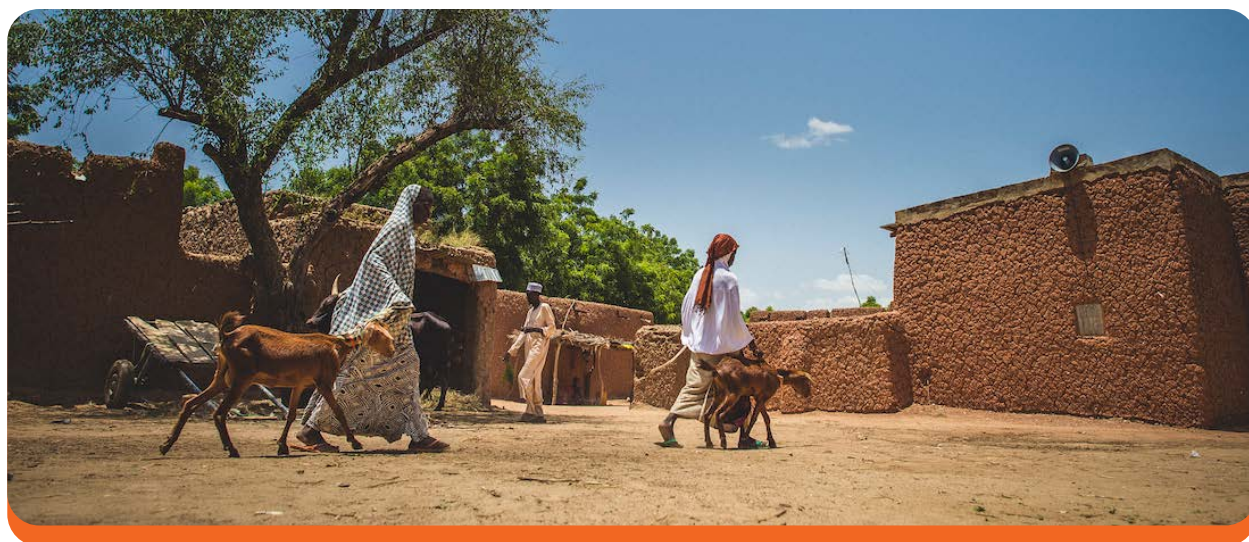
Hermanas caminan junto a sus cabras en Zinder, Nigeria. Sean Sheridan/Mercy Corps, 2016.

Recomendación clave: Las intervenciones diseñadas para fortalecer la acción colectiva pueden no desarrollar automáticamente la confianza. Los programas también deberían fomentar el aumento de la interacción positiva y controlar cómo las percepciones cambian en respuesta a las actividades que fomentan la acción colectiva.