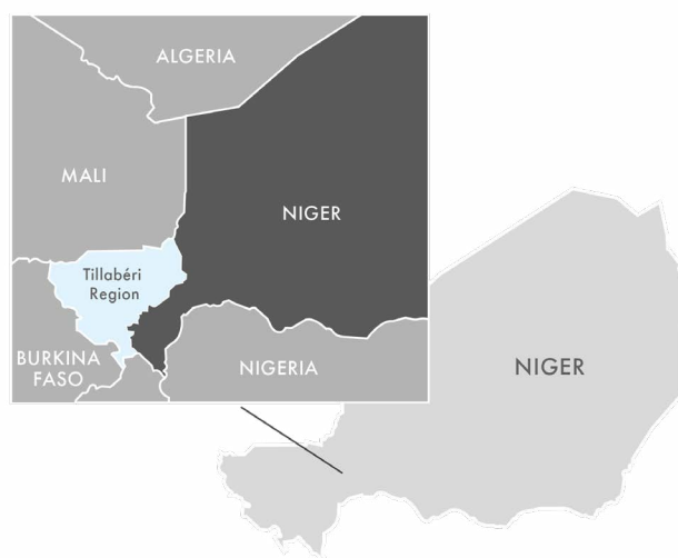
Figura I: La región de Tillabéri en Níger

La región de Tillabéri en Nigeria, obstaculizada por la prestación de servicios deficientes, la gobernanza débil y la corrupción, es un epicentro de múltiples factores de conflicto: una constante crisis socioeconómica; impactos