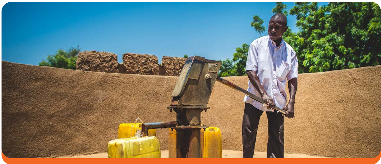
Un hombre bombea agua en Zinder, Nigeria. Sean Sheridan/Mercy Corps, 2016.