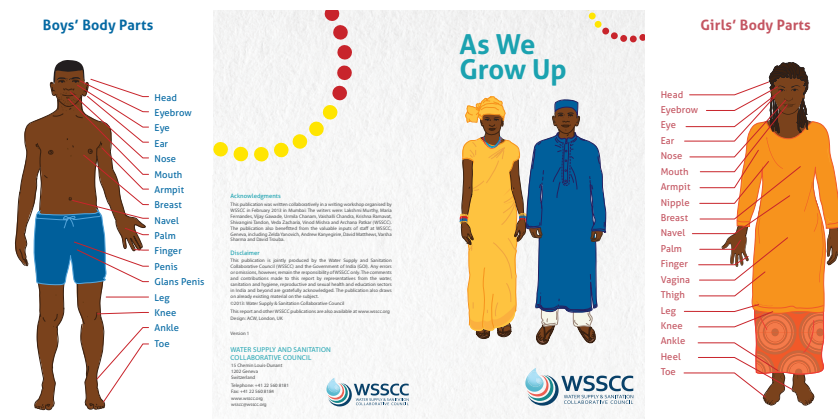
« As We Grow Up ».

contextes, par exemple, ce qui touche à l'incontinence ou un besoin plus fréquent d'uriner. En novembre 2014 dans le camp de Zaatari, en Jordanie, les couches pour adulte étaient coûteuses et/ou indisponibles, et une famille qui s'occupait d'un homme âgé souffrant d'incontinence fut contrainte d'improviser avec des guenilles et des draps en plastique (Venema 2015).